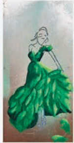
2024 - „Natural Beauty - Dancing Green“ Tanz & Modedesign in Einklang - aus der Serie Natural Beauties 25 x 50 cm

Erstes Werk auf Metall mit leichten Street-Art-Elementen 60 x 100 cm