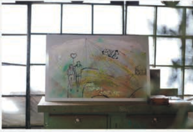
2023 - „Love“

Erstes Werk auf Metall mit leichten Street-Art-Elementen 60 x 100 cm