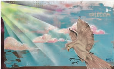
2025 - „Dove of Peace“